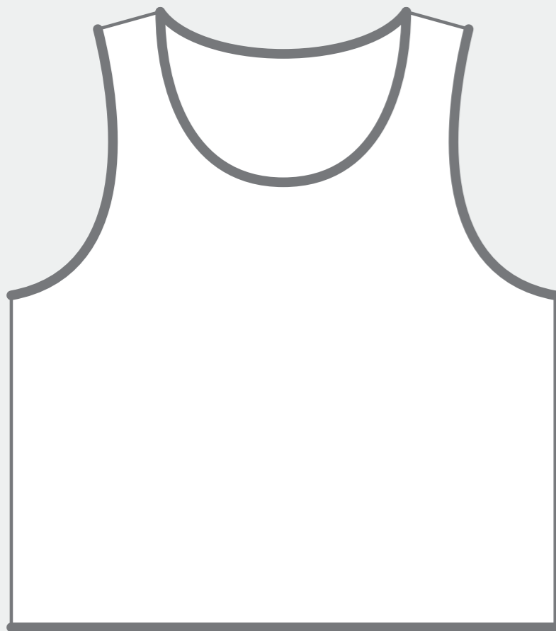
【 FRONT 】