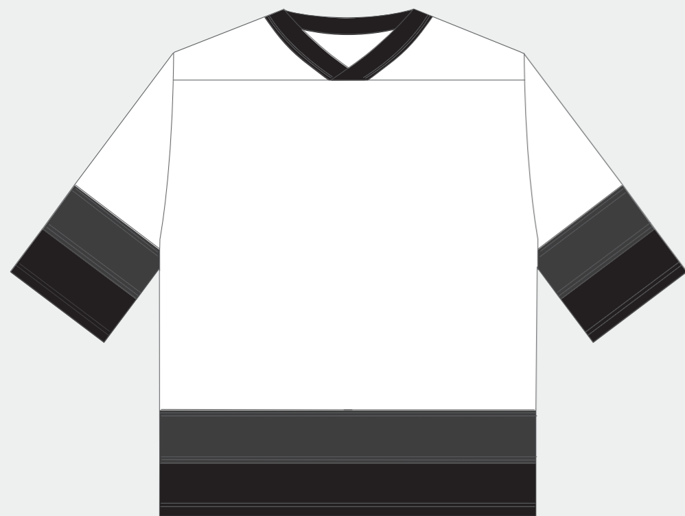
【 FRONT 】