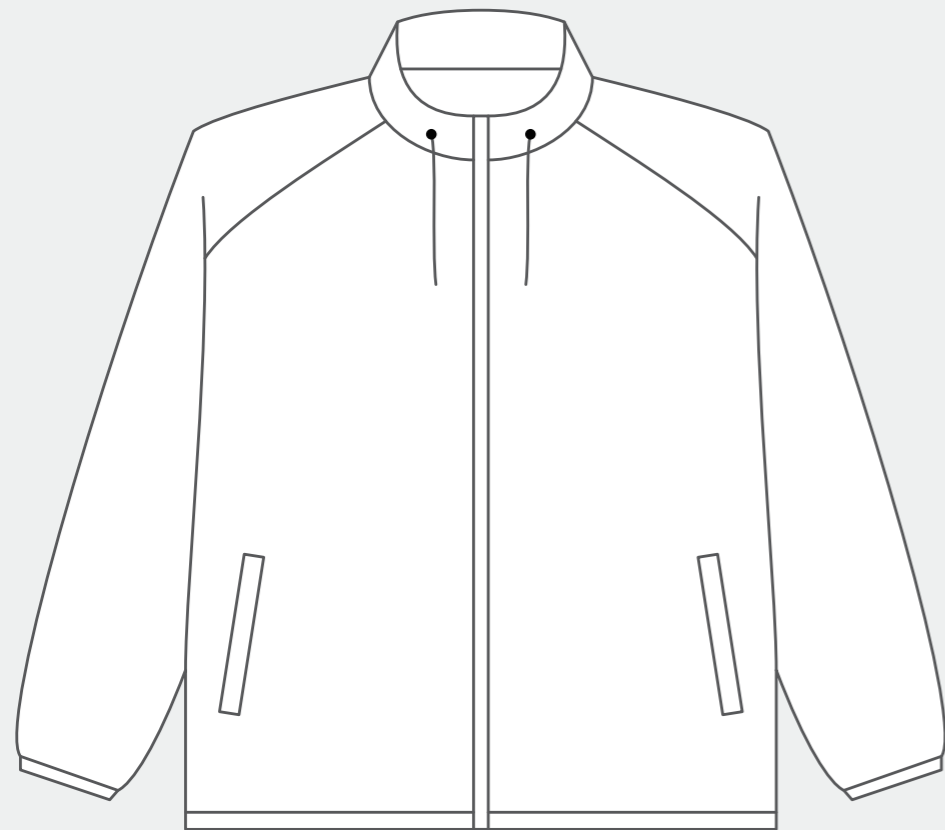
【 FRONT 】