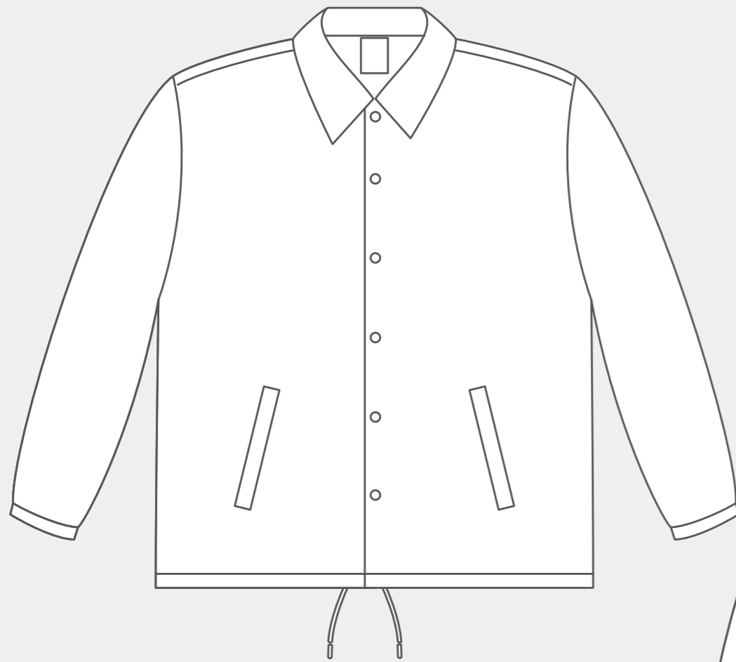
【 FRONT 】