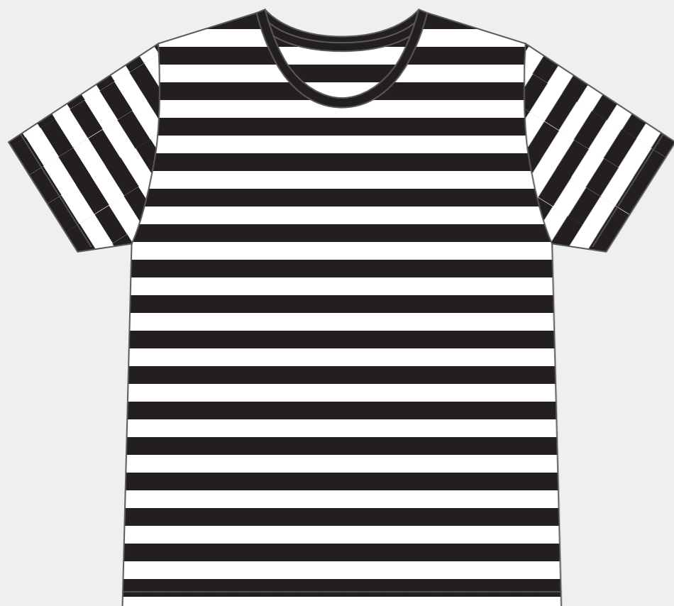
【 FRONT 】